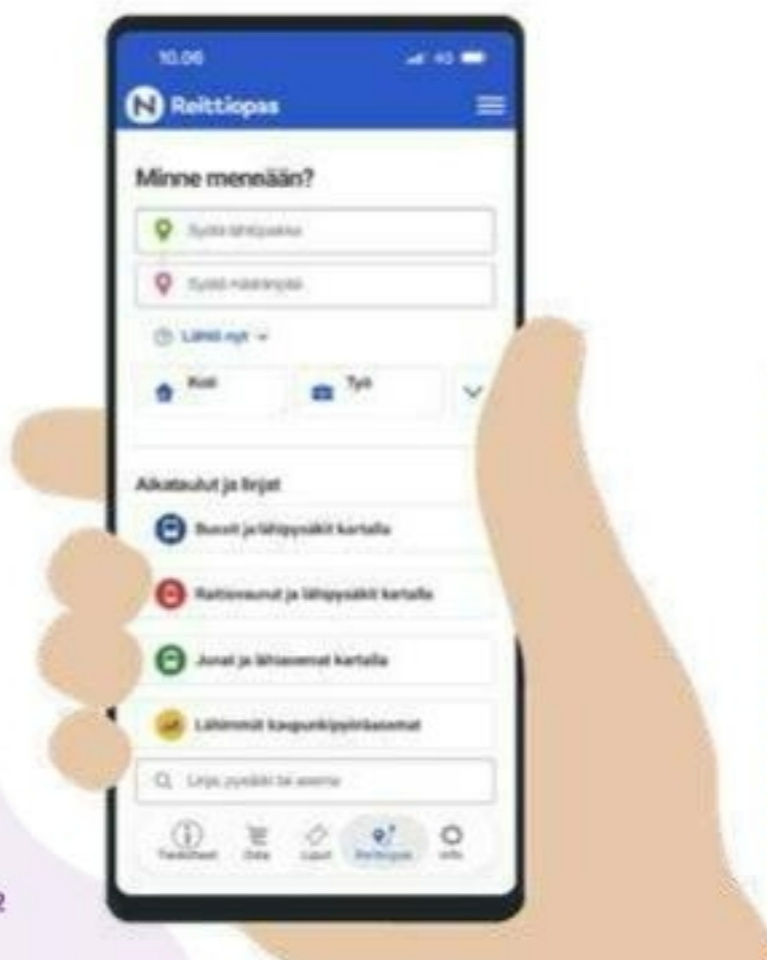
Kuva: Reittioppaan etusivun valikko

Mainosnäytöt ovat pääsääntöinen bussissa toteutettavan opastuksen ja etiketin viestinnän kanava. Tätä varten tulee matkustamonäyttöiltä varata nykyistä enemmän aikaa.