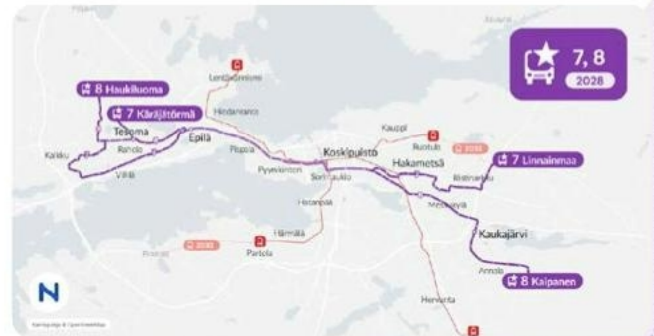
Kuva: Ensimmäisen vaiheen Plusbus-reitit.

Linja 8: Haukuluoma – Ikuri – Tesoma – Ristimäki – Tohlopinranta – Epilä – Pispala – Pyykinrinne – Keskustori – Koskipuisto – Sorin aukio – Yliopisto – Kalevanharju – Vuohenoja – Aakkula – Messukylä – Hankio – Kaukajärvi – Annala – Kaipanen.